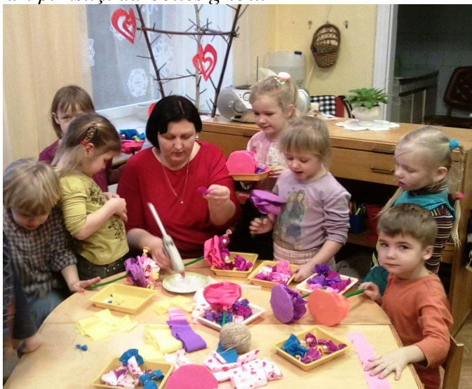
✍ Ineses teksts un foto